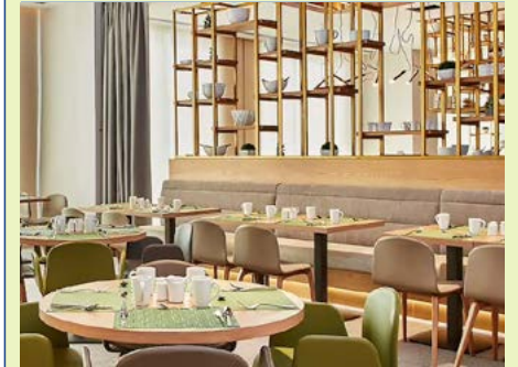
Frühstücksraum im Hilton Garden Inn