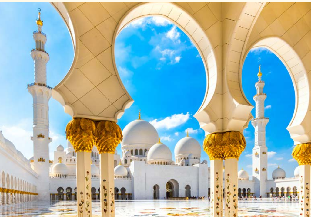
Sheikh-Zayed-Moschee in Abu Dhabi