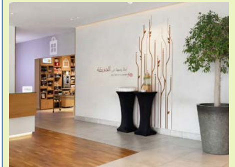
Lobby des Hotels Hilton Garden Inn